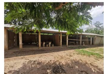
校舎2（3クラスルーム）