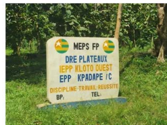
パダペC公立小学校