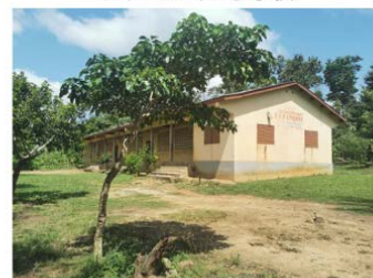
校舎1（3クラスルーム）