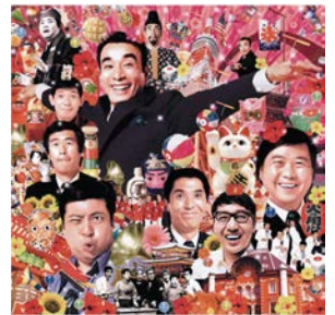
クレイジーキャッツ さて、メンバーの名前は言えますか？