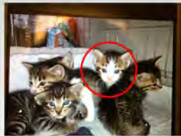
ひときわカメラ目線の この子が将来、私の親友となります。