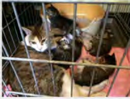
マンションに捨てられていた 母猫と5匹の赤ちゃん猫